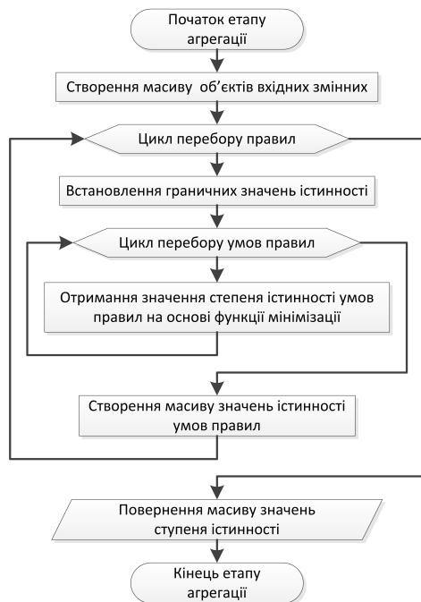
Рисунок 3 – Блок-схема етапу агрегації

де: \left[ \mu_{concl_i}^{Set}(t) \right] – активована функція належності; \mu_{concl_i}^{Set}(t) – функція належності терма; Verify(conclusion_i) – ступінь істинності i -го підвисновку; i = 1..m , m \in N . Виконання даної послідовності кроків дасть змогу в кінцевому висновку отримати для кожного підвисновку на множині правил певну сукупність активованих нечітких множин: