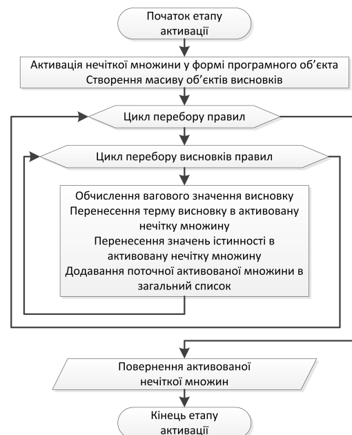
Рисунок 4 – Блок-схема етапу активації