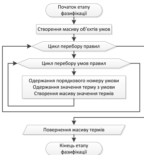
Рисунок 2 – Блок-схема етапу фазифікації