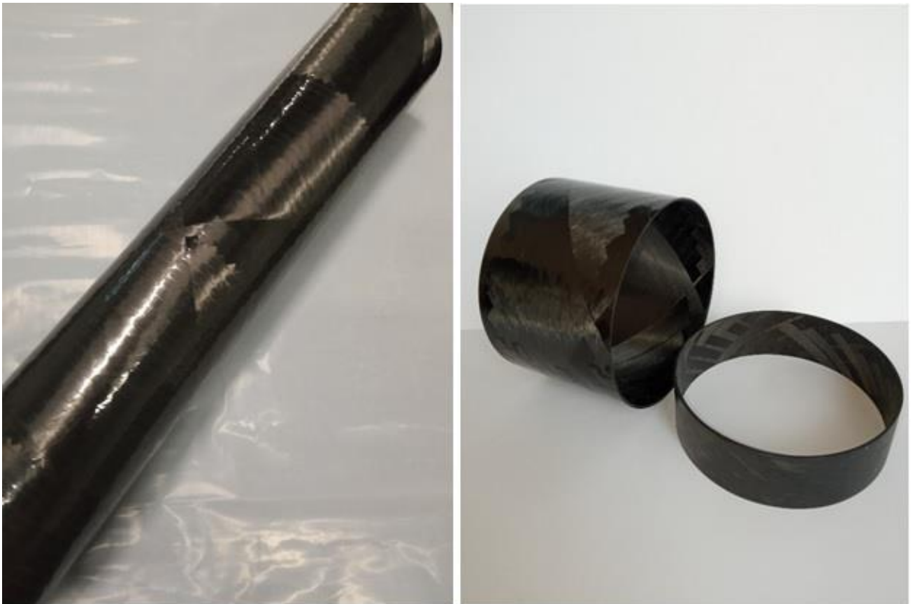
Рисунок 2 – Тонкостінний циліндр із вуглепластику та зразки, вирізані з технологічного припуску

ведене число проходів показує необхідну кількість подвійних спіральних витків для повного покриття поверхні оболонки намотування (таблиця 1) і значення має відповідати не менше 100. Кут довороту вказує на необхідний поворот поверхні намотування після закінчення проходу укладання його значення рекомендовано зводити до мінімуму. Графічна схема обраних структур намотування, сформована програмним комплексом WindingExpert, зображена на рисунку 3.