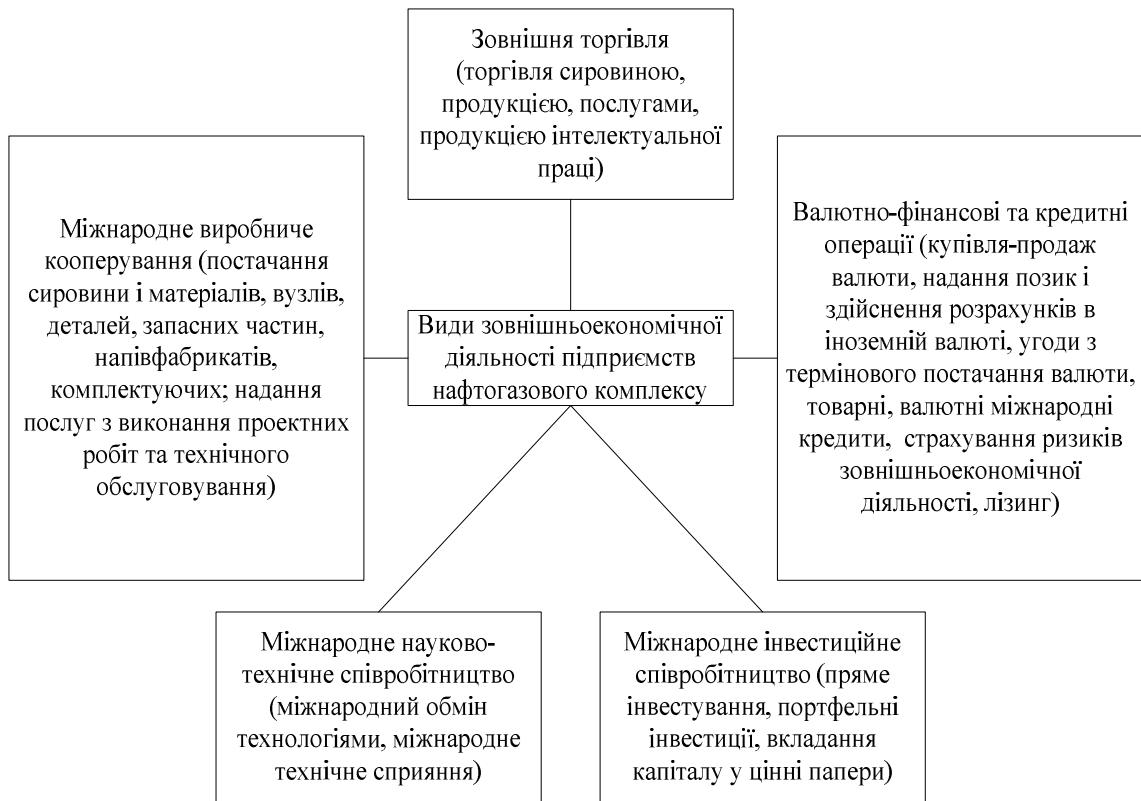
Рисунок 1 – Види зовнішньоекономічної діяльності, які здійснюють підприємства нафтогазового комплексу

які технологічно є більш розвинутими. Інтеграційне об'єднання МС не створює (додаткового) доступу до сучасних чинників виробництва (технологій виробництва та менеджменту тощо, а також до додаткових капіталів, що зазвичай супроводжують технології). Таким чином, як зазначено у аналітичній записці відповідних досліджень, в умовах інтеграції України до МС Україна не може розраховувати на значні ефекти від інституціоналізації цих стосунків. Проте значним негативним наслідком вибору на користь МС стане скасування (закриття) євроінтеграційного напрямку розвитку України [20, с. 40].