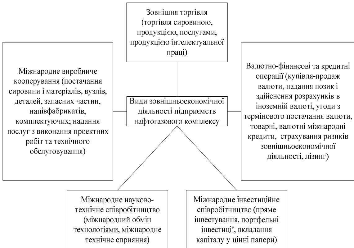
Рисунок 1 – Види зовнішньоекономічної діяльності, які здійснюють підприємства нафтогазового комплексу

які технологічно є більш розвинутими. Інтеграційне об'єднання МС не створює (додаткового) доступу до сучасних чинників виробництва (технологій виробництва та менеджменту тощо, а також до додаткових капіталів, що зазвичай супроводжують технології). Таким чином, як зазначено у аналітичній записці відповідних досліджень, в умовах інтеграції України до МС Україна не може розраховувати на значні ефекти від інституціоналізації цих стосунків. Проте значним негативним наслідком вибору на користь МС стане скасування (закриття) євроінтеграційного напрямку розвитку України [20, с. 40].