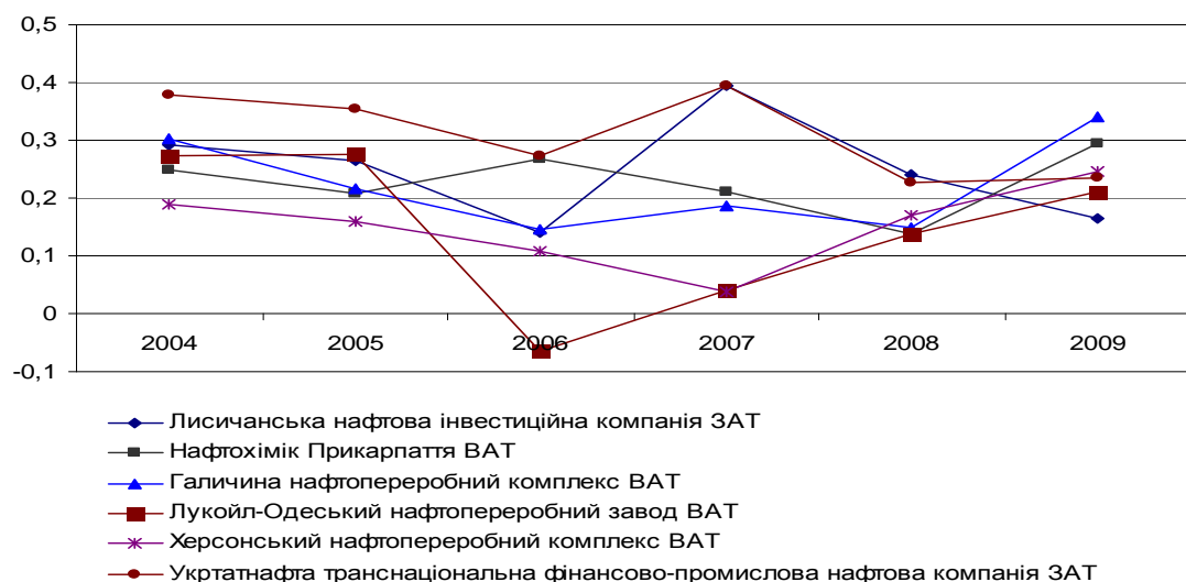
Рисунок 2 – Динаміка інтегрального показника ефективності діяльності підприємств нафтопереробної галузі промисловості