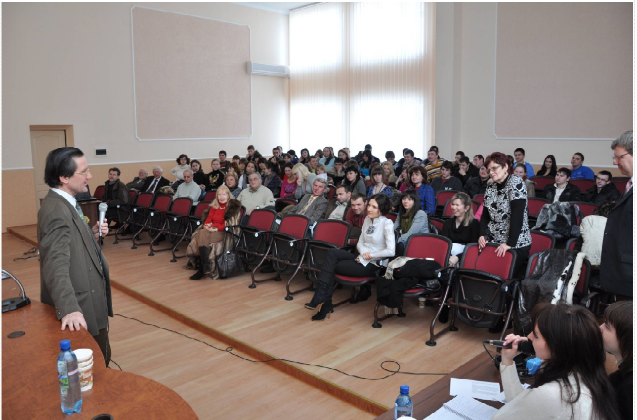
Рисунок 3 – Відповіді на численні запитання слухачів