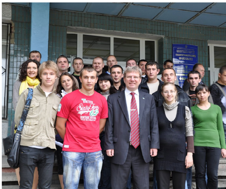
Рисунок 1 – Студентська спілка SEG ІФНТУНГ

Згідно з планом діяльності студентської секції SEG та при фінансовій допомозі компанії Shell в ІФНТУНГ 17 лютого 2010 року в конференц-залі корпусу нафтового обладнання успішно пройшла лекція італійського вченого Альємо Веснавера із циклу «Слухаємо і розмовляємо з нафтогазовим резервуаром» на тему: «Активна і пасивна сейморозвідка для моніторингу нафтогазових резервуарів».