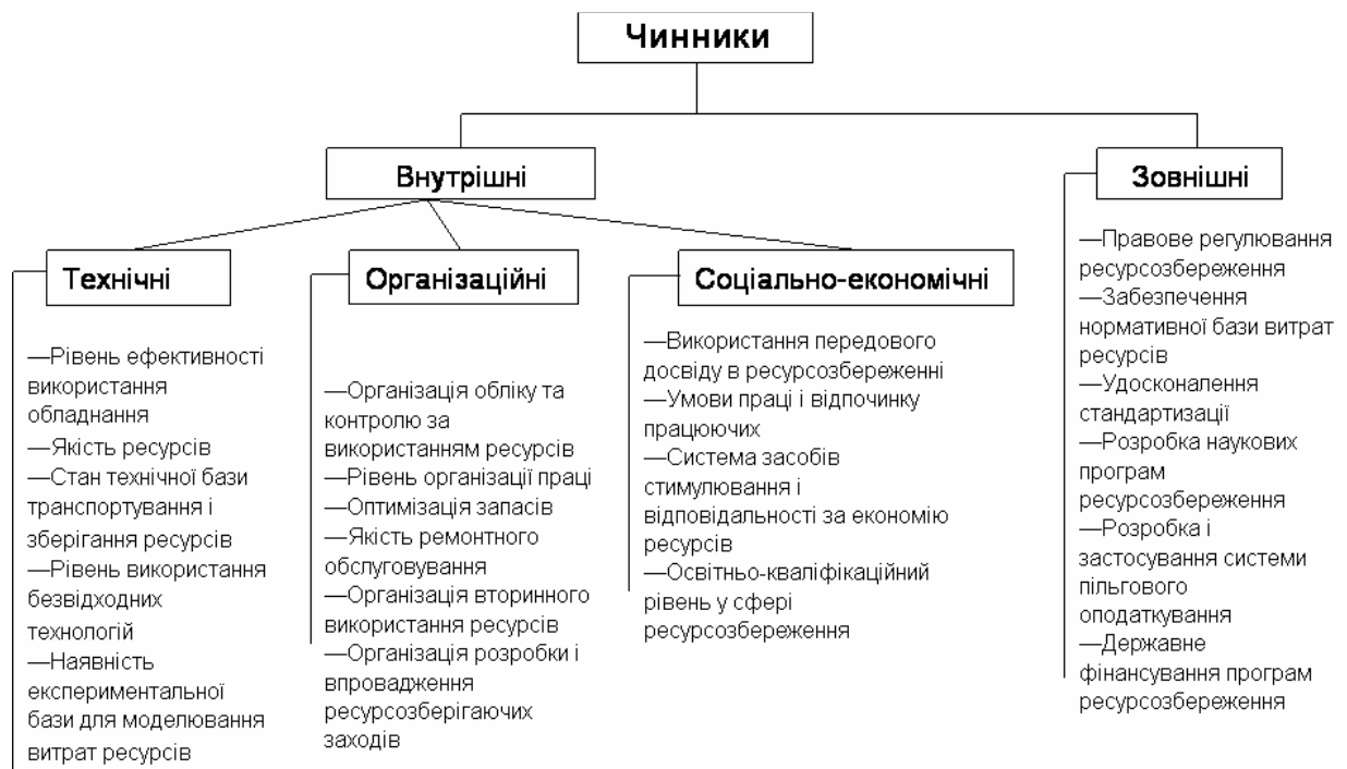
Рисунок 1 – Класифікація чинників ресурсозбереження

виробництв. На власні потреби галузі витрачається майже 10% від загального обсягу природного газу, що споживається в Україні. [2]. Беручи до уваги наведені вище факти, а також зважаючи на політичну ситуацію, що склалася у галузі транспортування газу, гостро постає питання про перегляд і удосконалення систем енергозбереження в даній галузі. Морально застаріле технологічне обладнання компресорних станцій, незадовільний стан газопроводів, а також ряд інших чинників спричиняють неефективний перерозподіл державних коштів, а саме: кошти, які могли б бути спрямовані на технологічне переозброєння галузі витрачаються на оплату додаткових об'ємів імпортованих енергоресурсів. В той же час, перевитрата ПЕР спричиняє зростання собівартості транспортування газу, що в кінцевому результаті зумовлює недоотримання прибутку.